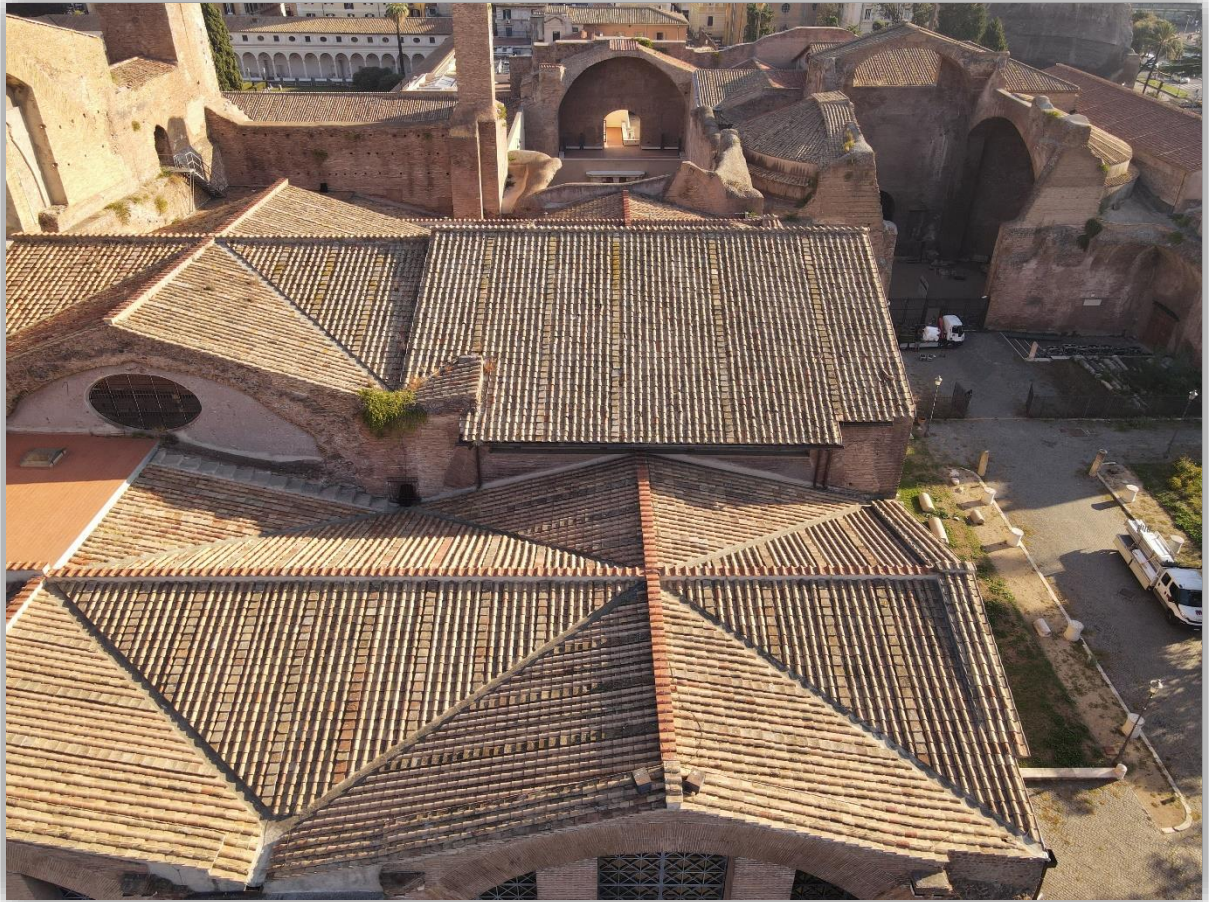
Le Grandi Aule – Visione d'insieme dall'alto