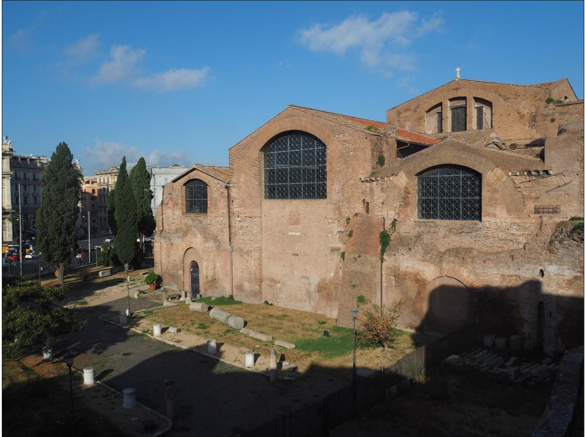
Stralcio 2 – Aule dalla I alla VII