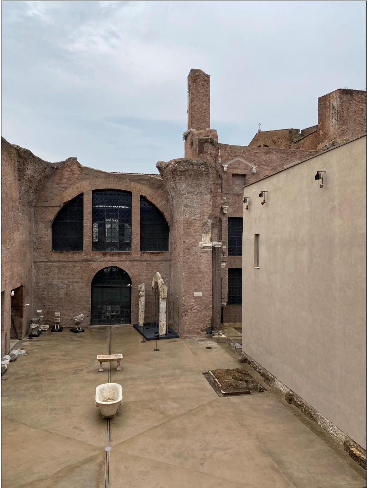
Stralcio 1 – Aula VIII