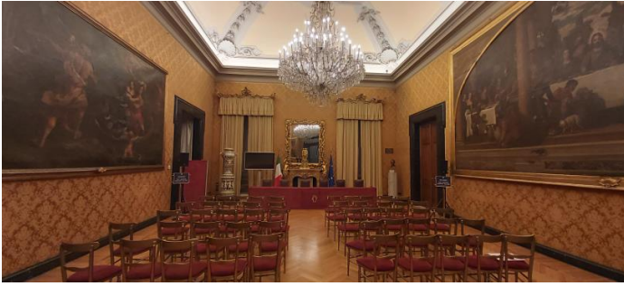
Progettazione e Direzione Lavori Roma Palazzo Montecitorio Sala Aldo Moro Restauro e valorizzazione Anno 2021

Nell'ambito degli incarichi di dirigente della Soprintendenza BAP per le prov. di BA, BT e FG e Soprintendenza BAP per le prov. di LE, BR e TA e Soprintendenza di Roma l'attività di tutela e salvaguardia dei beni architettonici, ambientali e paesaggistici risulta cospicua. In particolare, il recupero funzionale di immobili, realizzato anche a seguito di intese e accordi con gli Enti territoriali, rappresenta un obiettivo primario. A titolo esemplificativo, si riportano, di seguito, alcuni monumenti tra i più rappresentativi dell'area di competenza, oggetto di lavori di restauro al fine della loro valorizzazione e fruizione: