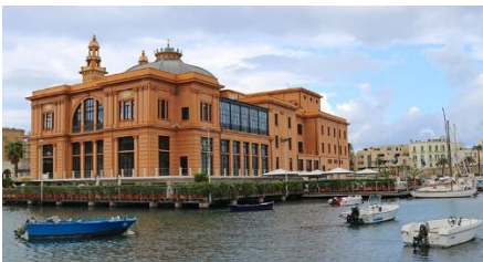
Responsabile unico del procedimento per i lavori di restauro del Teatro Margherita (BA); nota del 20.10.2009 prot. 8726 cl. 22.10.04/3.9