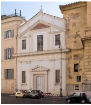
Responsabile unico del procedimento per i lavori di restauro dell'Ex Chiesa di S. Marta – Roma. A.F. 2008, perizia n. 21 del 6.6.2008