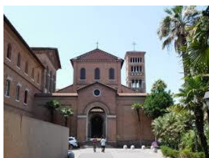
Convento e Chiesa di S. Anselmo Progettazione e direzione lavori di restauro campanile e convento dal 1995