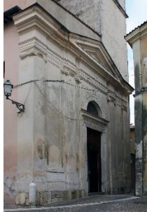
Abbazia a Chiesa di S. Nicola di Bari in Ponzano Romano (RM) Progettazione e direzione lavori di restauro e facciata Interventi nel 1990, 1991