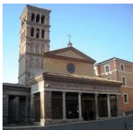
Convento di San Giorgio in Velabro in Roma. Progettazione e direzione lavori restauro interno e ricostruzione portico, campanile e facciate laterali Interventi dal 1991 al 1996