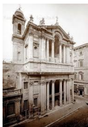
Chiesa di S. Maria in Via Lata in Roma. Progettazione e direzione lavori restauro interni, facciata e copertura Interventi dal 1988 al 2001