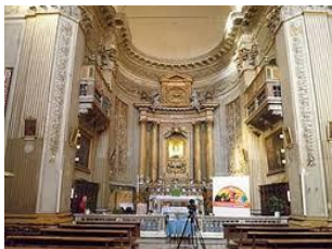
Chiesa S. Maria del Pianto Progettazione e direzione lavori di restauro interni e consolidamento 1998