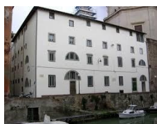
Ex Convento dei Domenicani e Chiesa di Santa Chiara Livorno. Incarico di coordinamento della progettazione e di direzione lavori di restauro e recupero funzionale con restauro facciate