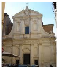
Chiesa S. Paolo alla Regola. Progettazione e direzione lavori di restauro interni e facciata e copertura Interventi dal 1996 al 1999; 2001