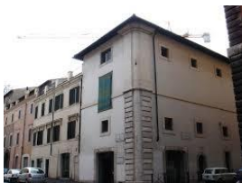
Cripta di Balbo Progettazione e direzione lavori di restauro Via dei Funari Interventi dal 1994