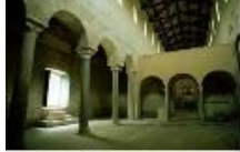
Chiesa di S. Andrea in Flumine. Ponzano Romano (Roma). Progettazione e direzione lavori restauro interno e facciata Interventi nel 1991