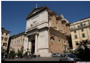
Chiesa e Convento (sec.XVI) di San Salvatore in Lauro in Roma. Progettazione e direzione lavori Interventi dal 1991 al 1999