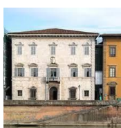
Palazzo Toscanelli ora Archivio di Stato di Pisa. Incarico di coordinamento della progettazione e di